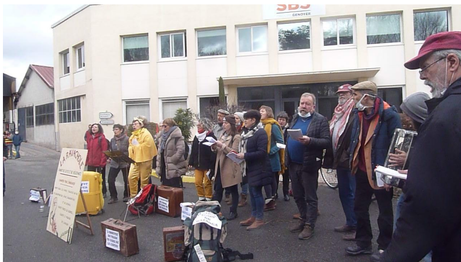
Clôture de la mobilisation avec la chorale de chants de lutte "La Ravachole"

https://lesmontsquipetillent.org/territoires-de-nouvelles-mobilites-durables-questionnaire/